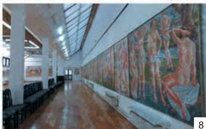
1. Gradski muzej, Vršac 2. Narodni muzej, Zrenjanin 3. Muzej, Srema 4. Muzej naivne umetnosti "Ilijanum", Šid 5. Galerija Milan Konjović, Sombor 6. Spomen zbirka Pavla Beljanskog, Novi Sad 7. Galerija Matice srpske, Novi Sad 8. Galerija slika Sava Šumanović, Šid