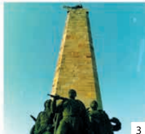
1. Kapela mira, Sremski Karlovci 2. Spomenik Branka Radičevića, Stražilovo 3. Iriški venac

Znameniti ljudi učine da i mesta na kojima borave postanu znamenita. Nekad su u pitanju znameniti pojedinci, a nekad znamenite skupine ljudi, koji se nađu na nekom mestu bez namere da budu znameniti, ali sled događaja učini da i oni i mesto na kome su se našli uđu u istoriju. Nađemo se na nekom mestu, slučajno ili namerno, ni ne znajući da se nalazimo na istorijskom lokalitetu, dok ne ugledamo spomen obeležje koje nas o tome obavestava.