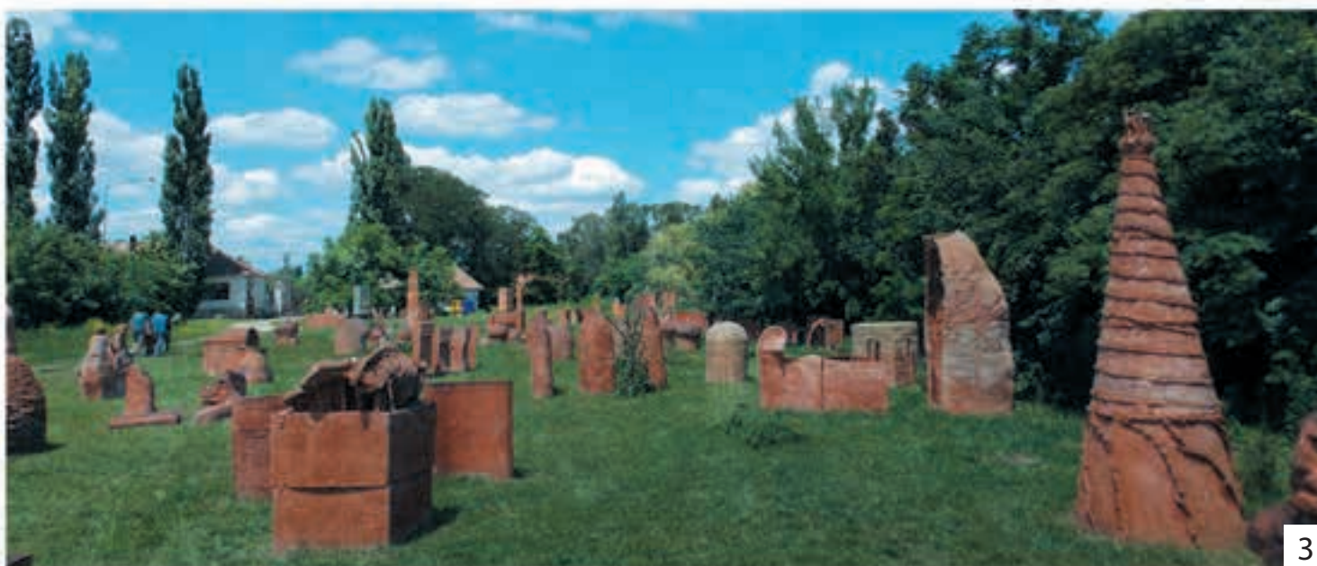
1. Galerija Naivne umetnosti, Kovačica 2. Galerija Likovni susret, Subotica 3. Galerija "TERRA", Kikinda 4-5. Sterijino pozorje 6. Srpsko narodno pozorište, Novi sad